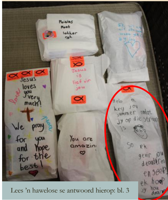
Lees 'n hawelose se antwoord hierop: bl. 3